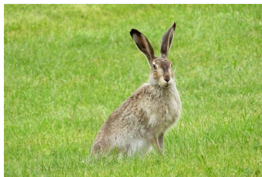
Haren lever på åbne marker

En hare kan føde unger flere gange om året. Den føder ungerne på jorden og giver dem kun mad en gang om dagen.