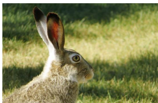
Haren har gule øjne på siden af hovedet