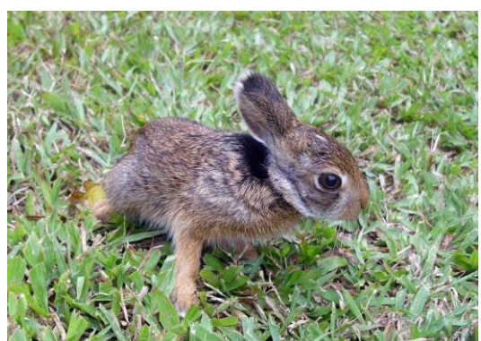
En lille hareunge på græsset