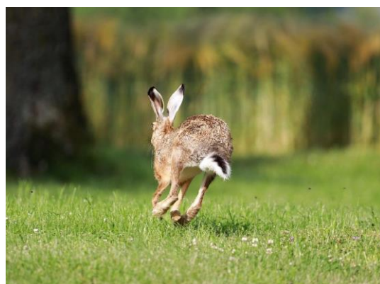
En hare kan løbe meget hurtigt