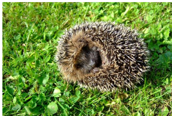
Et pindsvin kan rulle sig sammen til en kugle

Et pindsvin spiser små dyr som snegle, orme, larver og biller. Den kan også godt spise frøer og frugt. Den kan bedst lide at finde mad om natten.