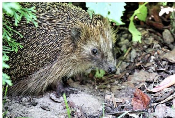
Pindsvin gemmer sig om dagen