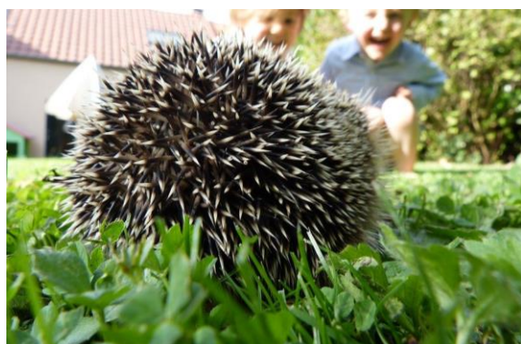
Pindsvin har over 5000 pigge