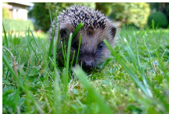
Et pindsvin i en have.